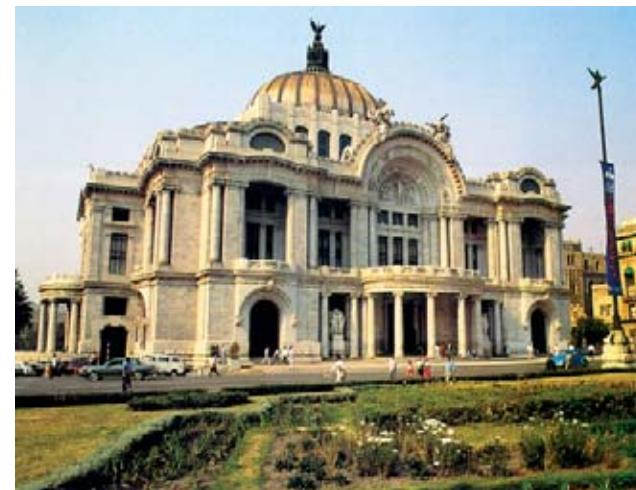
Antropologiako Museo Nazionala eta Arte Ederretako palazioa.

Penintsula honek Mexikoko golkoa Karibe itsasotik banatzen du. Karibeko hondartza turistikoengatik da ezaguna (Cancún, Playa del Carmen, Tulum, Cozumel, Isla Mujeres) baita mayen aurriengatik (Chichén Itzá, Tulum) eta Chicxulub-gatik, zenbait teoriaren arabera, orain dela 65 milioi urte dinosaueroak desagertzeko erantzule izan zen meteoritoa jauzi zeneko gunea. F