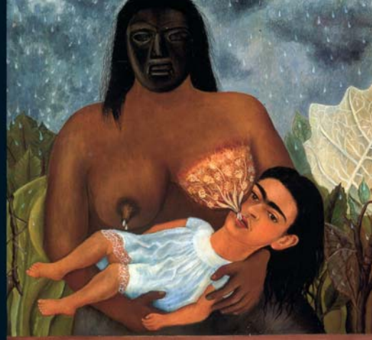
Mi nana y yo, 1937

También sabemos del terrible accidente de tranvía que marcaría el resto de su vida, postrándola en la cama durante meses y llevándola a pintar, impidiéndola ser madre, arrastrándola por infinidad de hospitales y operaciones, obligándola a grandes sufrimientos y adicciones, provocando su prematura muerte a la edad de 47 años.