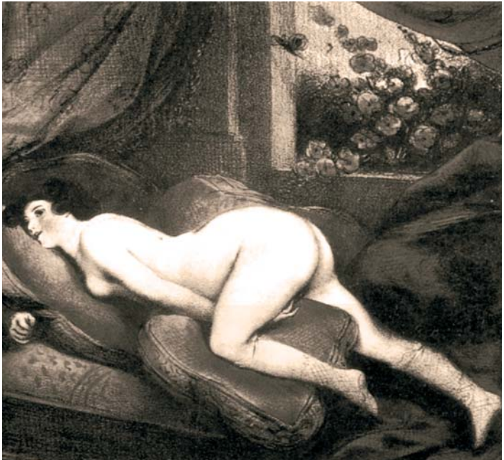
Las fantasías sexuales ayudan en el acto de la masturbación a difuminar los bloques que el cuerpo pueda tener.

El tener una fantasía que moralmente puede no estar bien vista no lleva implícito el deseo de materializarla. Inevitablemente, si digo culpa, moral, sacrificio, pecado, castigo, ¿a qué les recuerda? “Tengo