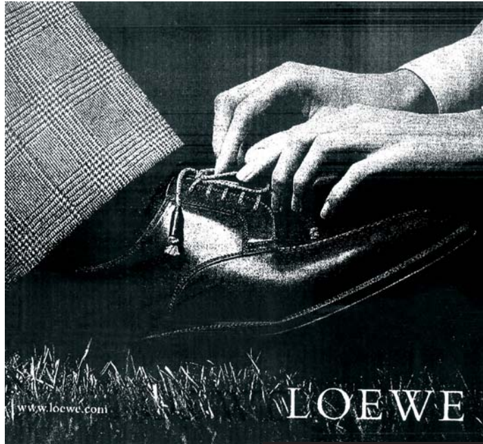
Anuncio de prensa "LOEWE"

puestas". Este caso se repite en cantidad de anuncios de perfumes, tabaco, bebidas refrescantes y alcohólicas, productos de salud y belleza, joyas...y no podemos dejar de lado, las revistas masculinas donde la mujer cumple el único papel de representar un absoluto objeto sexual. Habitualmente nos muestran a la mujer como un objeto de placer y deseo que está al servicio sexual masculino. Una posesión del hombre, un objeto de usar y tirar, que es desechable cuando uno se cansa de ella. Es una lástima pero el machismo imperante que emana de estas publicaciones parece estar socialmente admitido. En este campo todo vale en cuanto a la degradación de la mujer, un mensaje que viene a reforzar una mentalidad un tanto retrógrada. F